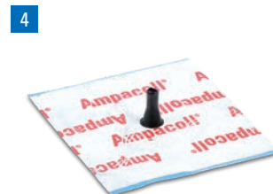
Ampacoll® Elektro/Install Vorgefertigte Manschetten