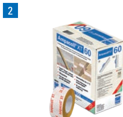
Ampacoll® XT 60 Acrylklebeband